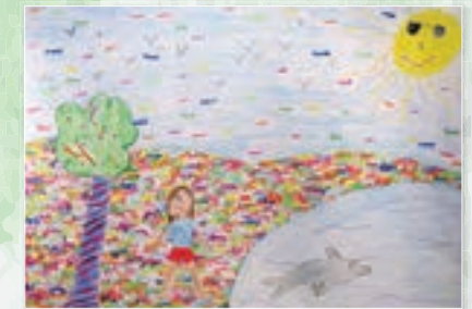
4. Plaz - Tamina Hopp (2004)