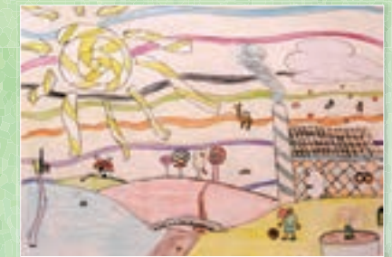
4. Plaz - Thomas Lambert (2002)