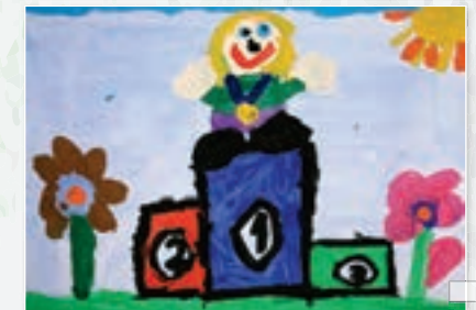
3. Plaz - Shenna Kent (2007)