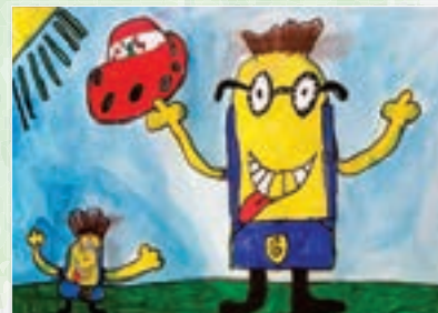
4. Plaz - Lucas Oliveira (2005)