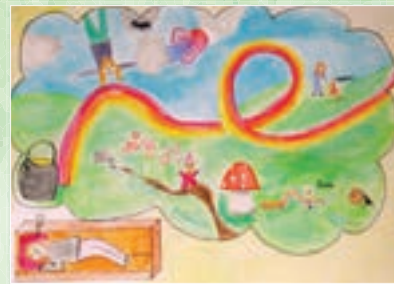
4. Plaz - Anouk Heynes (2003)