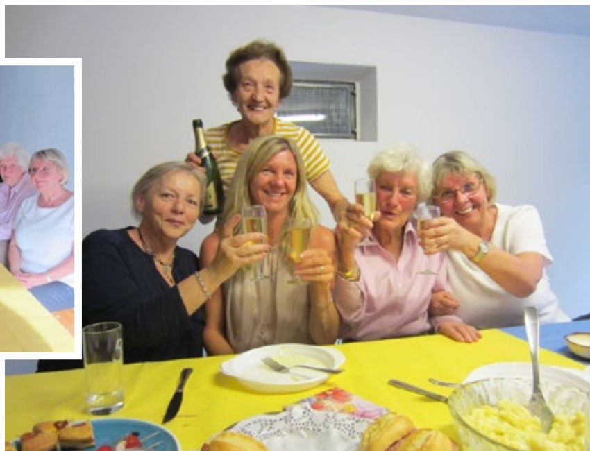
... an der rue des Champs