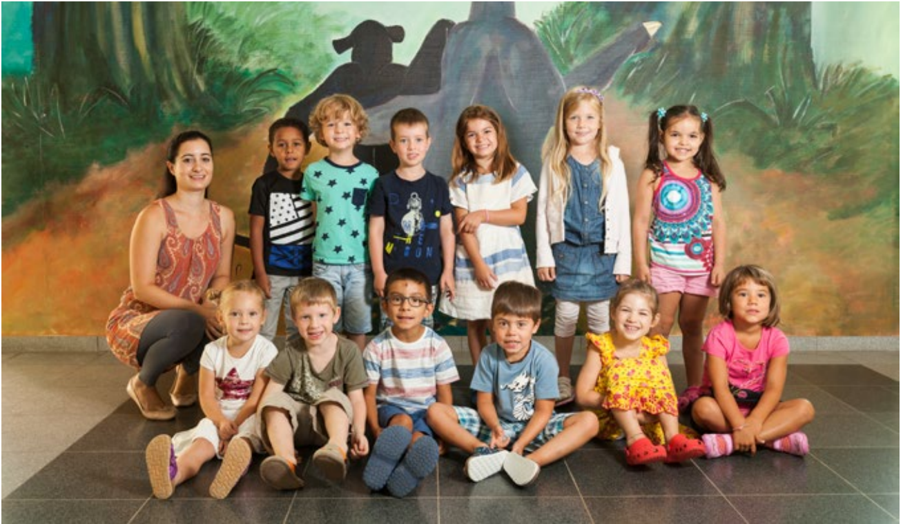
Cycle 1.1 an 1.2 Klasse B