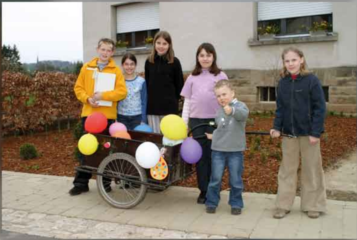
MIR si klibbere GAANG! DEN 10. APRËLL 2004